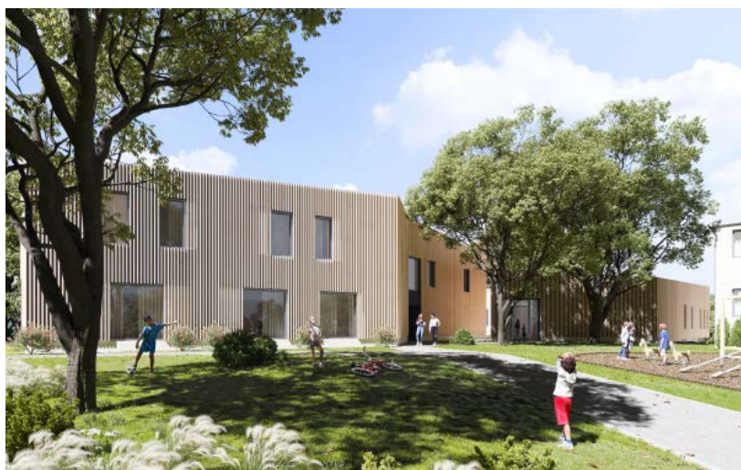
Visualisierung: FAT Architects, Moutfort

Kinderheim im luxemburgischen Schiffflange: Das partizipative Konzept wird mit einem integralen Planungsteam in Holzbauweise entwickelt