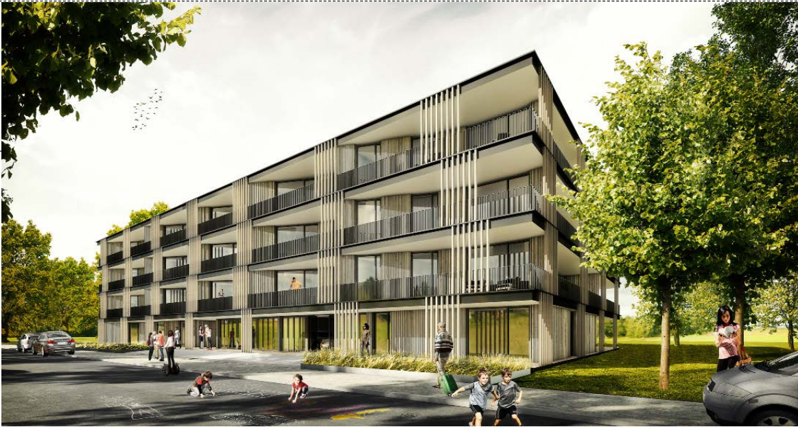
Visualisierung: FAT Architects, Moutfort

Die Visualisierung zeigt beispielhaft, wie der soziale Geschosswohnungsbau „auf der grünen Wiese“ aussehen kann. Sämtliche Elemente des Gebäudes werden standardisiert digital aufgebaut, um für alle Bauaufgaben die passende Lösung zu bieten