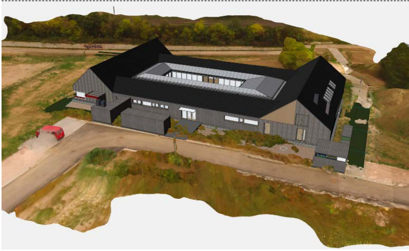
Visualisierung: stereoraum Architekten, Wörrstadt

Neubau einer Kindertagesstätte für die Gemeinde Wörrstadt. In der Abbildung ist das Gebäudemodell aus Archicad mit der 3D-Punktwolke des Geländes überblendet. Damit lässt sich das geplante Modell schnell im realen Bauumfeld überprüfen